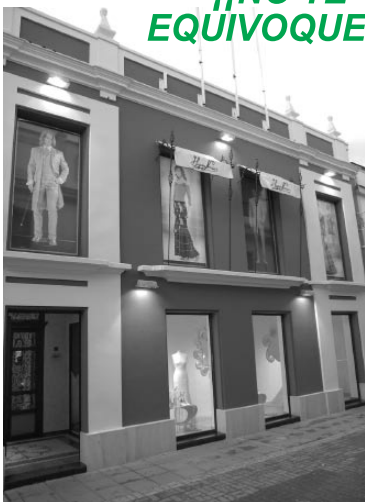
C/. Portales, 4 - Tlf. 957 63 86 88

www.higarnovias.com FUENTE PALMERA (Córdoba)